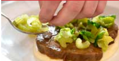
strana 6 – 7

MENU KRÁĽOVSKÉ, CENY ĽUDOVÉ Hotel Gino Park Palace ponúka okrem gurmánskeho zážitku aj romantiku či turistiku.