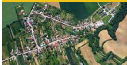
strana 9 – 11

ŠTVRTOK NA CELÝ ROK Navštívili sme obec, kde sa športuje za výsadbu nových líp.