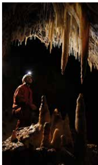
zdôj: Lukáš Kubičina

„Zatiaľ je zmapovaná dĺžka asi 3800 metrov, čo sú takmer štyri kilometre chodieb. Na západné Slovensko je to nepredstaviteľné. Jaskyňa je, samozrejme,