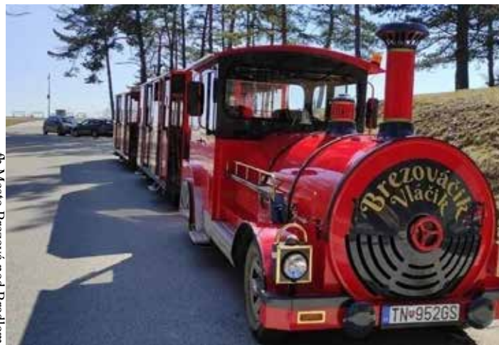
fb Mesto Brezová pod Bradlom

1. mája odštartoval kúpeľnú sezónu v Trenčianskych Tepliciach. Jazdí každú polhodinu od Kostola sv. Štefana. Počas letnej sezóny, teda od júna do