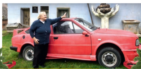
Reportáž z konca kraja