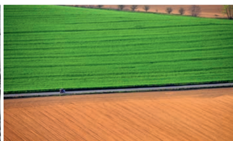
1. miesto: príroda