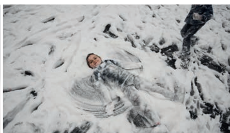
1. miesto: momentky z podujatí