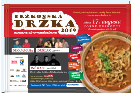
17. Držkovská držka 2019